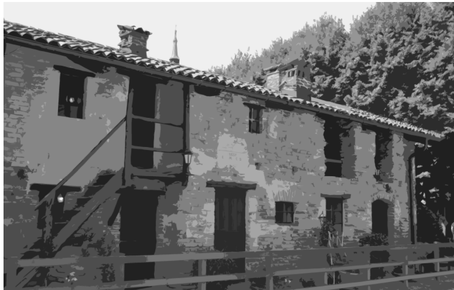
Het ouderlijk huisje van de Bosco's